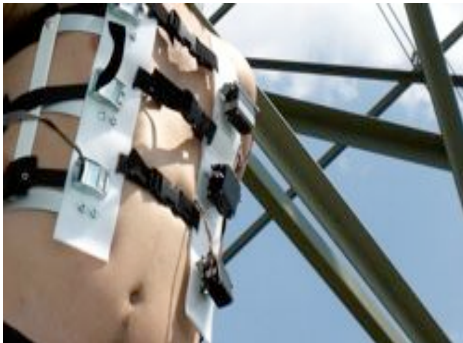
Artist: Gordan Savicic ©