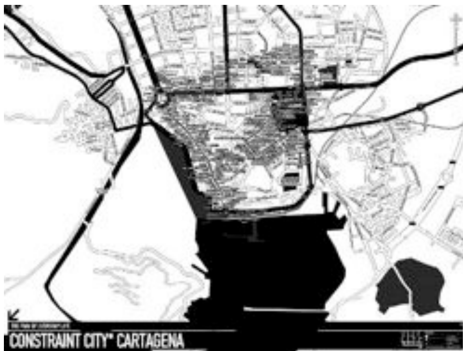
Artist: Gordan Savicic ©