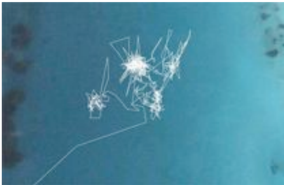
Yolande Harris Taking Soundings: Anchor , color print with GPS sonification, 2007